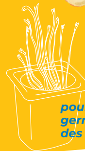
pour faire germer des graines