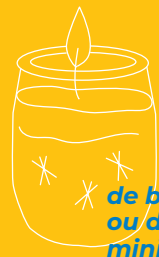
de bougeoir* ou de mini-vase

* Ne pas utiliser de pot en plastique pour le bougeoir.