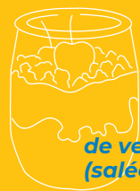
de verrine (salée ou sucrée)

Quelques Idées en + Le pot peut servir :