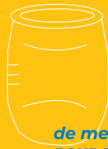
de mesure pour cuisiner